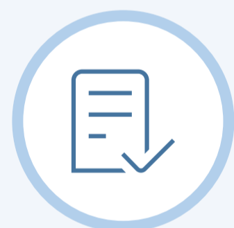
Photo (fond blanc)

Originaux des diplômes, attestations d'expérience, certificat de casier judiciaire (avec apostille/légalisation + traduction en chinois)