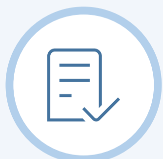
Foto (fondo blanco)

Originales de diplomas, certificados de experiencia, certificado de antecedentes penales (con apostilla/legalización + traducción al chino)